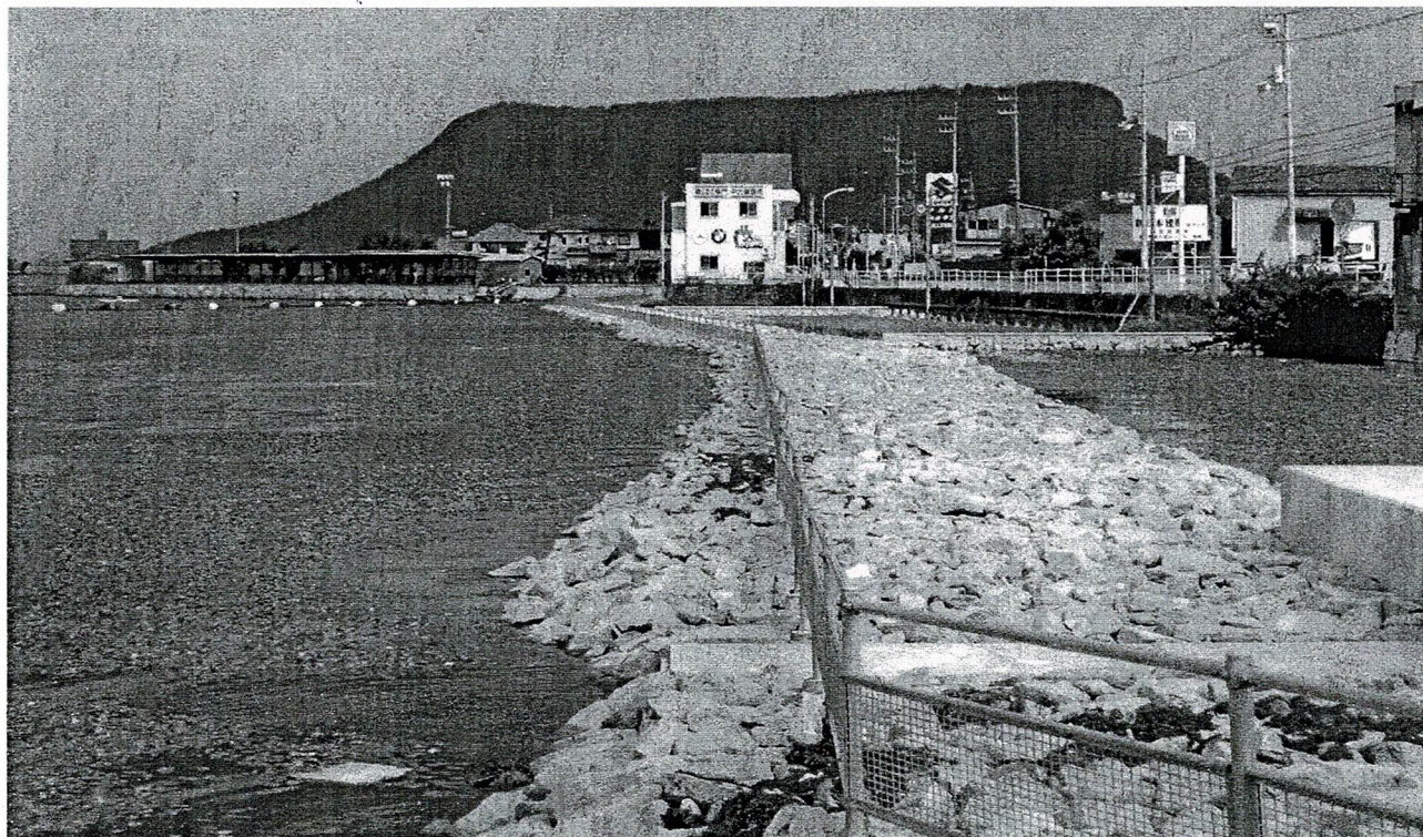
久米池「アサザ」自生地より屋島を望む