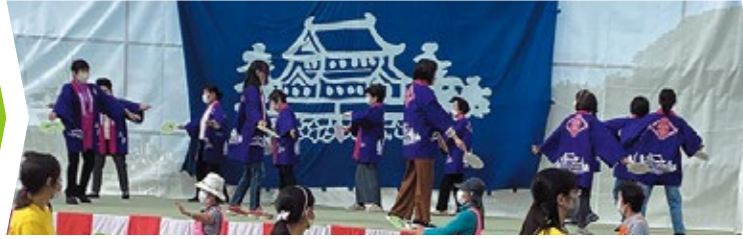
古高松地区コミュニティ協議会