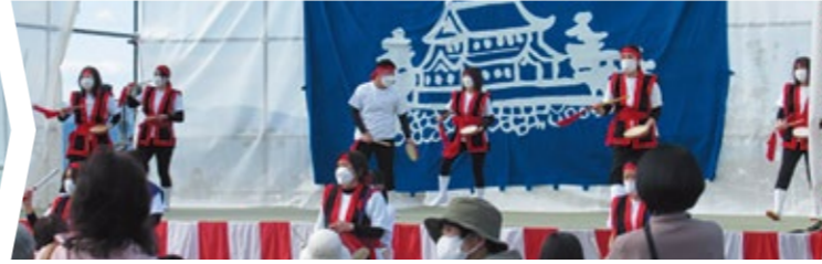
かすがの風(春日こども園)