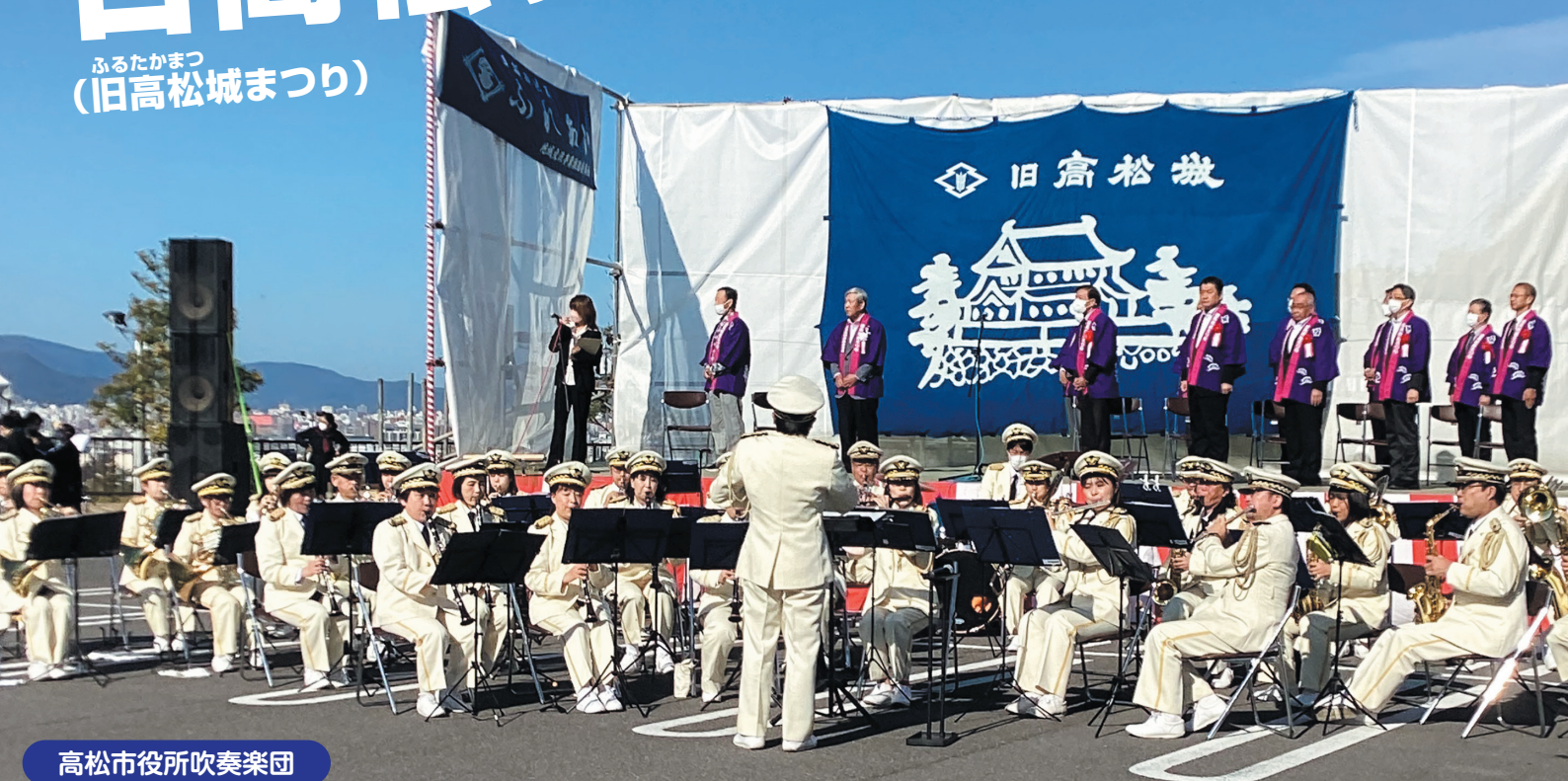
高松市役所吹奏楽団