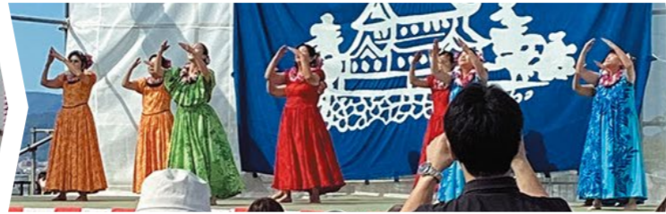
ハウオリーズマサコアケタフラスタジオ