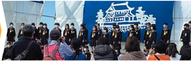
古高松南小学校合唱クラブ