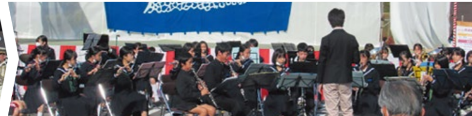
古高松中・小学校 吹奏楽部