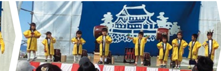
つくし幼稚園 プリティミュージックスクール