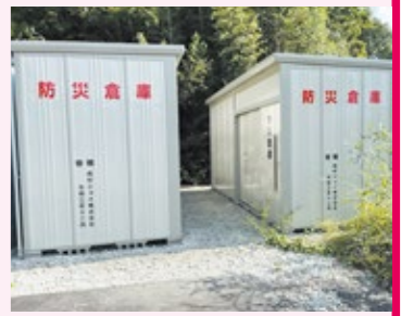
トイレ用テント 間仕切り チェーンソー ショベル 発電機

古高松地区自主防災連合会では、令和3年度東部運動公園に新しく防災倉庫を2棟設置し、中身の充実を図るため、今年度宝くじによるコミュニティ助成事業を活用して、トイレ用テントをはじめ、間仕切り・チェーンソー・ショベル・発電機などを購入しました。