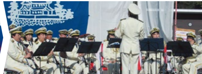
高松市役所吹奏楽団