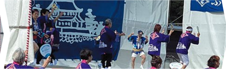
古高松・古高松南コミセン講座