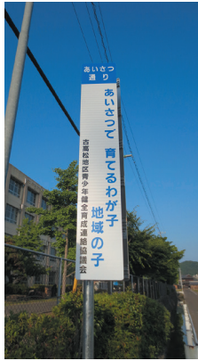
古高松中学校正門横

コロナ禍で地域での声かけも思うように出来ない状態が続いていますが、子どもたちを思う気持ちを込めてこの度、「あいさつ通り」に3基の看板『あいさつで育てるわが子 地域の子』を設置しました。